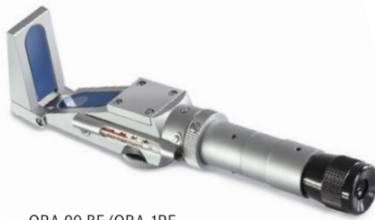
ORA 90 BE/ORA 1RE