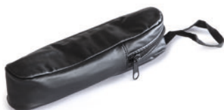
Estuche de imitación de cuero ORA-A2103