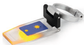
Tapa Prisma ORA-A1101