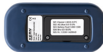
Vista posterior, tapa atornillada del compartimento de la pila