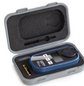
Maletín de transporte