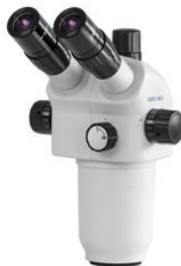
Cabeza de la serie OZO-5 (OZO 556)