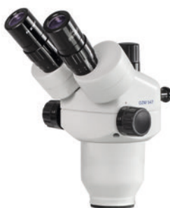
Cabeza de la serie OZM-5 (OZM 546, 547)