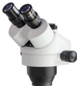
Cabeza de la serie OZL-46 (OZL 461, 462)