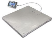
Bilancia da pavimento