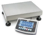
Bilancia a piattaforma