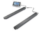
Bilancia a piattaforma